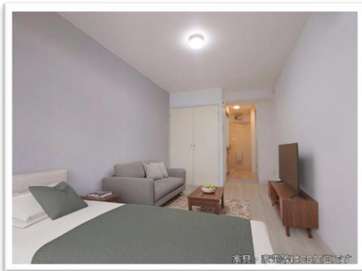
※写真の家具等はイメージです