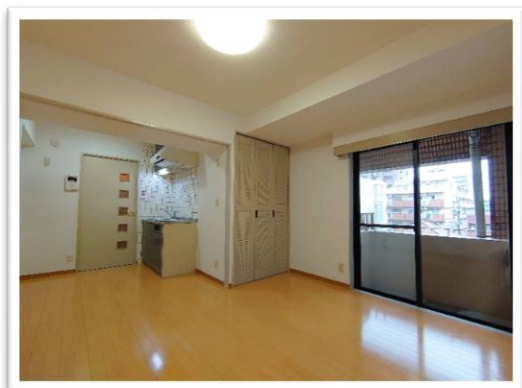
※同タイプの部屋写真となります 工事の仕上がりは実際と

共用設備：水道管直結給水方式 エレベーター・オートロック・防犯カメラ イッツコム1M無料及びBフレッツ対応 宅配BOX設置・駐輪場(別途500円) 専有設備：エアコン1台・モニタ付インターホン 温水洗浄便座・フローリング 浴室暖房乾燥機・出窓付き IHクッキングヒーター(2口) 居室照明付・洗髪洗面化粧台 (専任媒介)