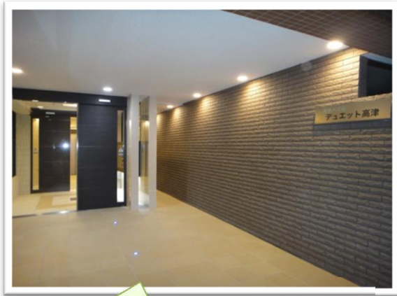
平成22年12月エントランス・ 外壁修繕リニューアル